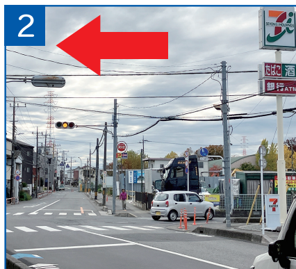
2 セブンイレブン様がある交差点を 左折し400m直進