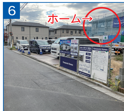
6 右手に建物がございますので 駐車場をご利用ください