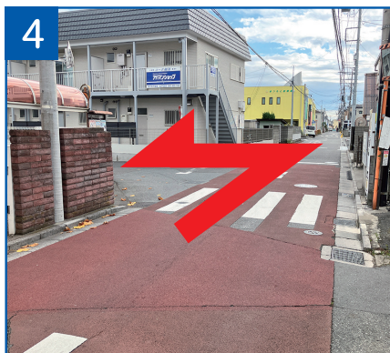
4 公園過ぎてすぐのT字路を左折し 110m進む