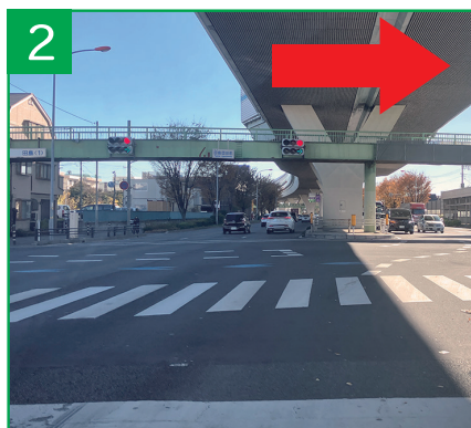
2 国道17号田島団地前交差点を右折 国道40号(新座・志木方面)へ300m直進