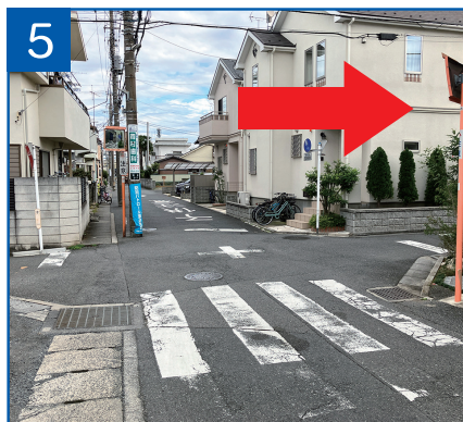
5 1個目の交差点を右折し100m 直進