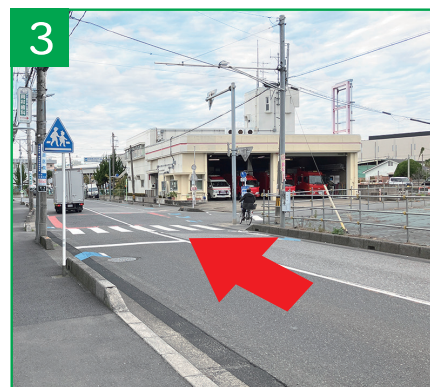
3 さいたま市消防局桜消防署西浦和 出張所様を通過