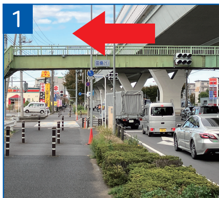
1 国道17号田島団地前交差点を左折 国道40号(新座・志木方面)へ300m直進